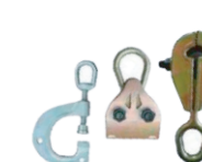
Mordazas tipo G, de rodamiento y de tipo C.