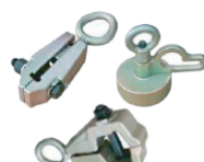
Mordazas auto-ajustables, para choques y de caja.