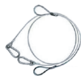
Cuerdas de Acero inoxidable gruesa y delgada