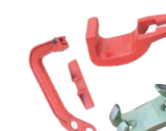
Gancho grande, de 90°, de conexión y bloqueo de cadena