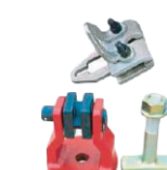
Mordazas de tracción bidireccional y descendiente.