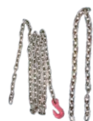
Cadena Larga y Corta