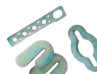
Placas perforadas de tracción, conexión de cadena y de tracción.